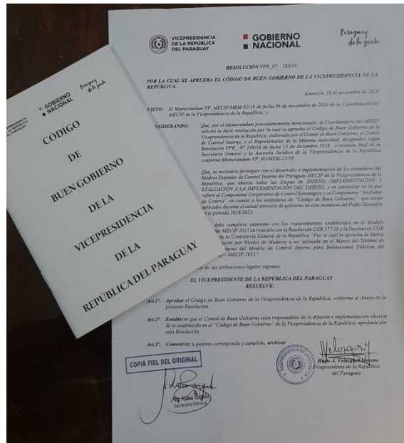
Muestra de los manuales de bolsillo de las diferentes políticas insitucionales aprobadas por la Máxima Autoridad: